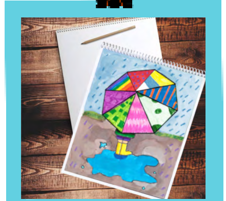
Cuaderno de bocetos 8 1/2" x 11" con 60 páginas en blanco