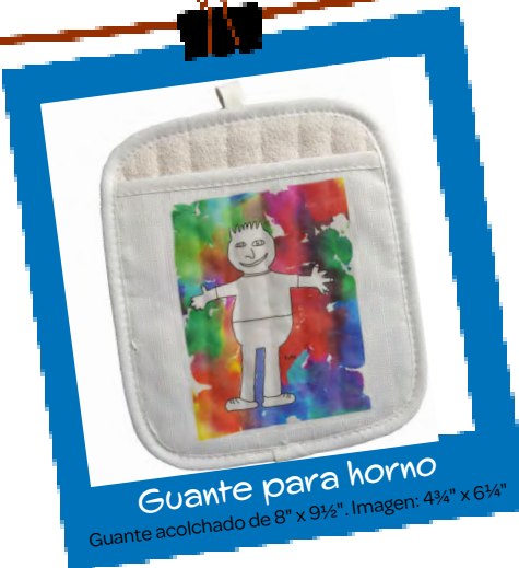
Guante para horno Guante acolchado de 8" x 9 1/2". Imagen: 4 3/4" x 6 3/4"