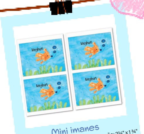
Mini imanes Paquete de 4 imanes sin laminar. Tamaño: 2 1/4" x 1 3/4"