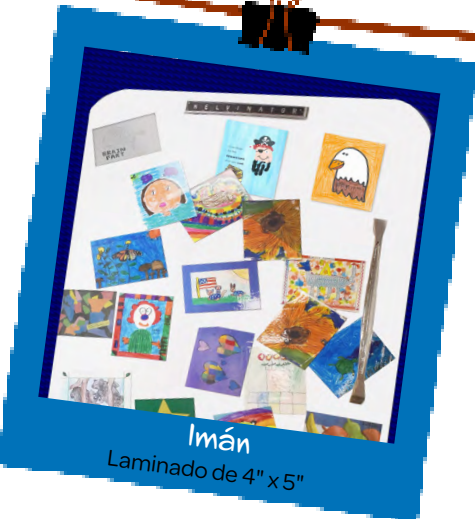
Imán Laminado de 4" x 5"