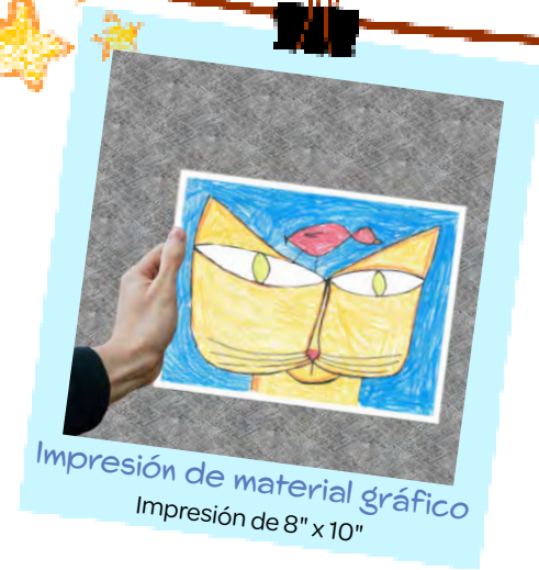
Impresión de material gráfico Impresión de 8" x 10"