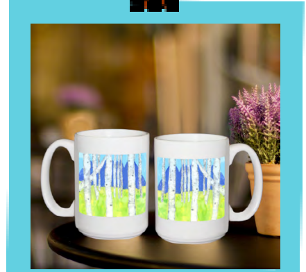
Tazón grande de 15 onzas Cerámica. Misma imagen en ambos lados.